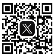
公式 X (旧ツイッター)