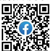
公式フェイスブック